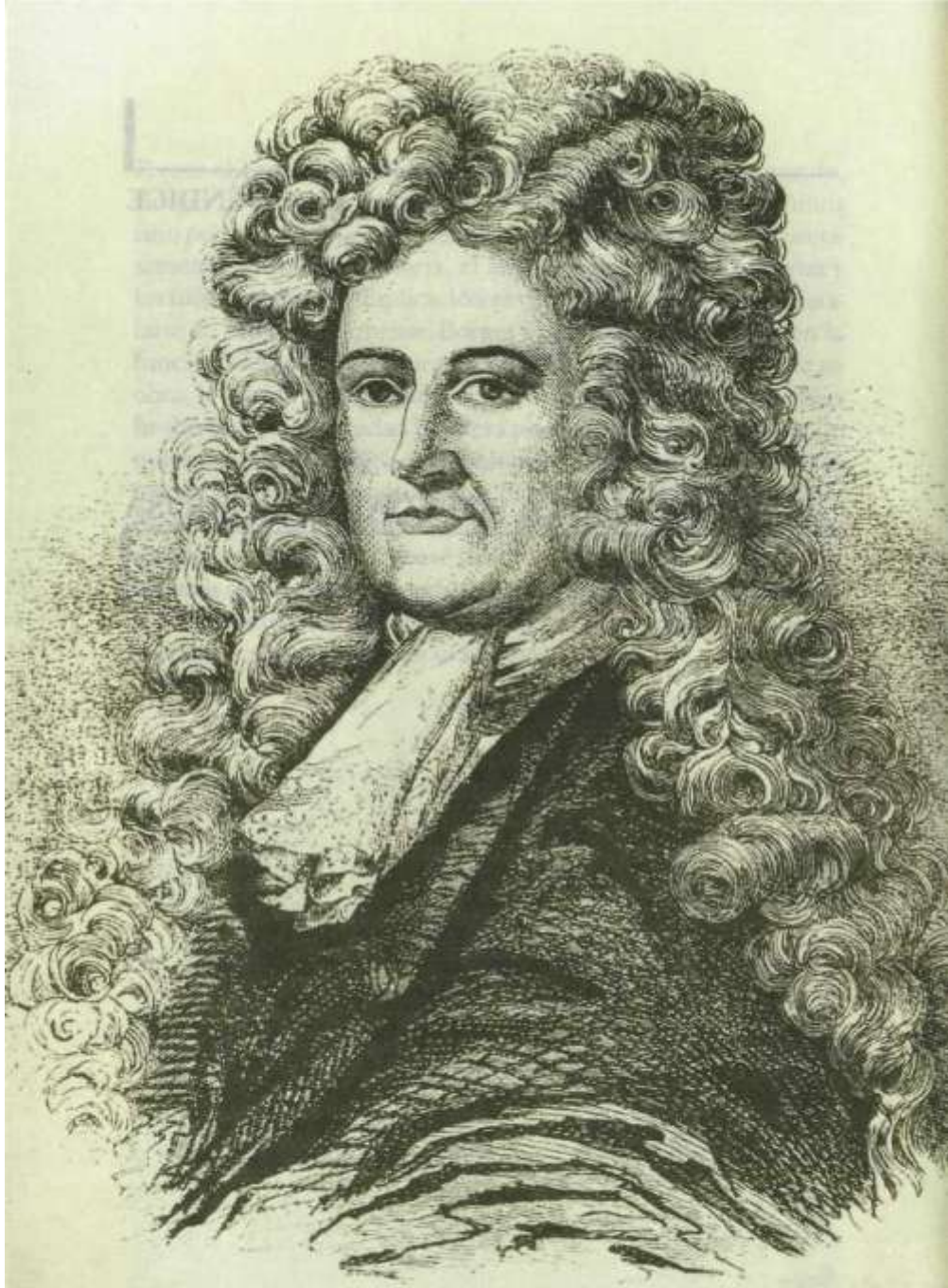
DANIEL DE FOE